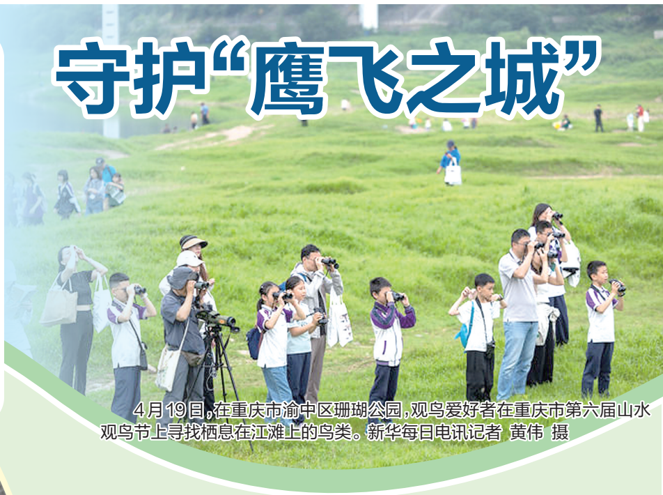
4月19日，在重庆市渝中区珊瑚公园，观鸟爱好者在重庆市第六届山水观鸟节上寻找栖息在江滩上的鸟类。