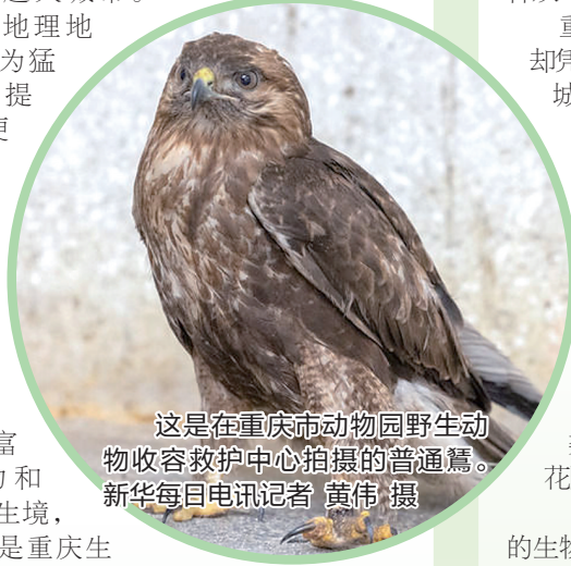
这是在重庆市动物园野生动物收容救护中心拍摄的普通鵟。

“综合整治后，保护区生物多样性更加丰富，近几年还新发现了国家一级保护动物小灵猫。”重庆缙云山国家级自然保护区管理局局长杨泉说，保护区现有植物2209种、野生脊椎动物200余种，成为猛禽觅食、迁徙的重要停歇地。