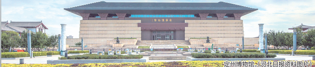
定州博物馆。

一座县级博物馆，连起历史与当下，守护千年文脉，融入现代生活，让悠悠古韵跃动在今、打动人心。(据人民日报)