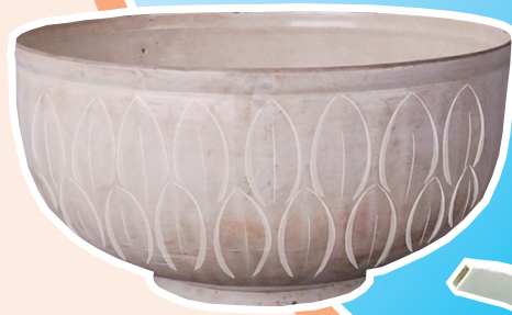
北宋定窑白釉刻花鱼纹碗。