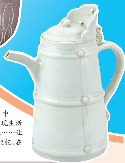
元代青白釉多穆壶。

又到国际博物馆日。博物馆正在经历一场身份重构，不仅是知识殿堂，更是承载公共记忆、提供情绪价值的文化空间。