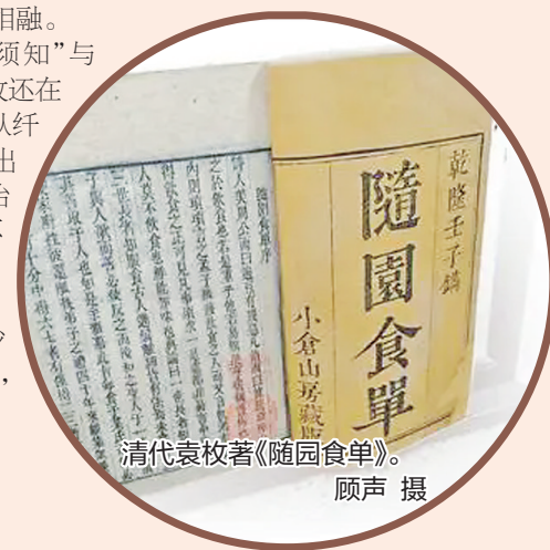
清代袁枚著《随园食单》。

《随园食单》不只是一本古人的“饮食指南”，也在字里行间传递着作者对中华传统文化的思考与理解。“有过时而不可吃者”是顺应自然、顺势而为的哲学；“饭之甘，在百味之上”，是不可舍本逐末的人生智慧；“凡事不宜苟且”里，寻求饮食升华为诗意生活的仪式感。