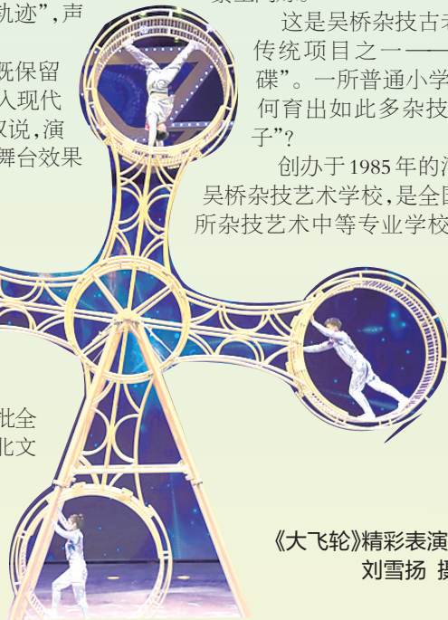
《大飞轮》精彩表演。刘雪扬 摄