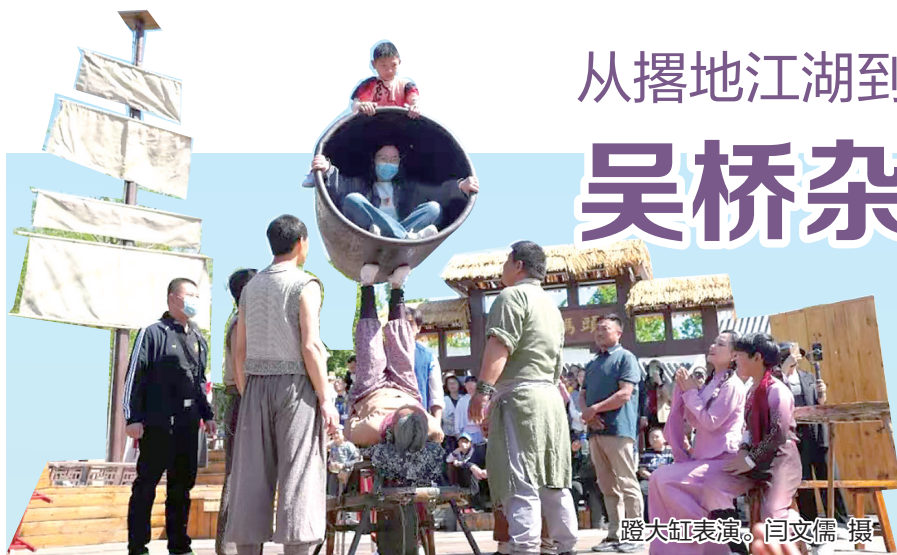
蹬大缸表演。