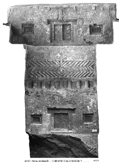
▲图为M4第一土雕建筑立面正射影像。