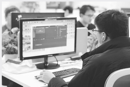
OPC创新社区里的工作者。

如今，在专业咨询、创意设计、跨境电商等细分赛道，创业者无需大规模团队即可满足市场需求。电商平台、自媒体平台、远程协作工具日益普及，创业者无需线下门店和固定团队，就能销售产品、拓展客户、运营业务，试错成本大幅降低。