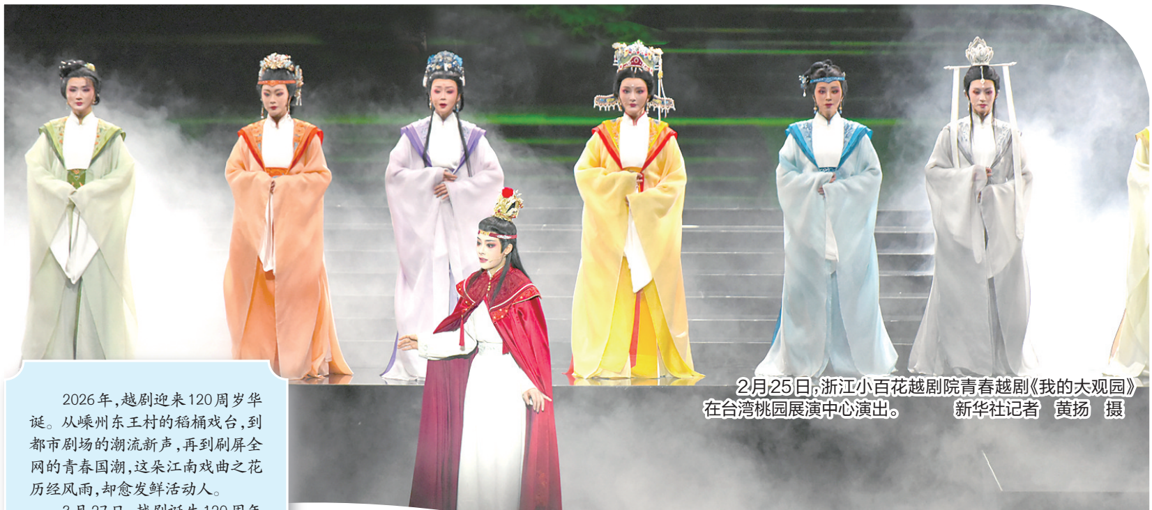
2月25日,浙江小百花越剧院青春越剧《我的大观园》在台湾桃园展演中心演出。

2026年,越剧迎来120周岁华诞。从嵊州东王村的稻桶戏台,到都市剧场的潮流新声,再到刷屏全网的青春国潮,这朵江南戏曲之花历经风雨,却愈发鲜活动人。