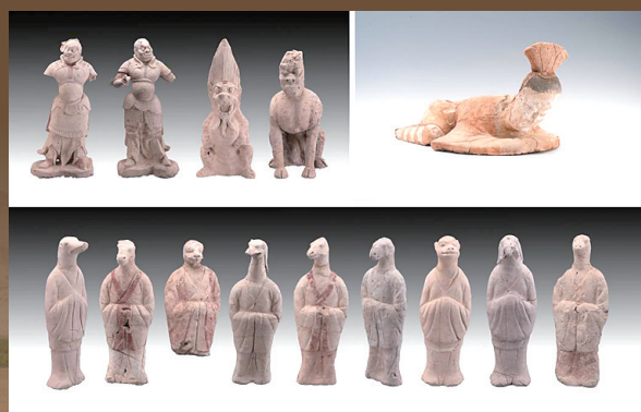
新疆吐鲁番市巴达木东晋唐时期墓群出土的陶俑(资料照片)。

考古学家正通过木材溯源、颜料分析、绘画技法等研究，为唐代西域与中原的贸易往来提供新证据；DNA分析结果可能展现唐代西域的人口流动与民族融合情况……这些微观层面的历史细节，将一点点拼凑还原成中华民族共同体形成的宏大图景。(新华社)