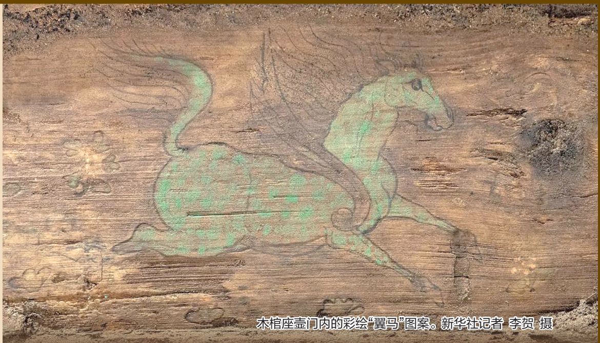
木棺座壶门内的彩绘“翼马”图案。

这片高昌先民的公共墓葬区，以丰富的实物遗存，生动诠释了晋唐时期西域与中原“家国同风”的历史图景，见证了统一多民族国家体系下新疆历史发展，成为研究中华文明多元一体格局的珍贵考古标本。