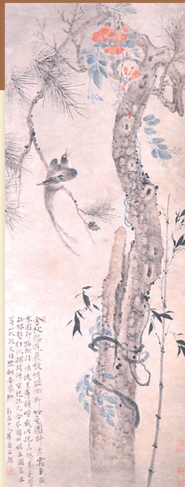
清 华岳《松竹绶带图》 君甸艺术院藏