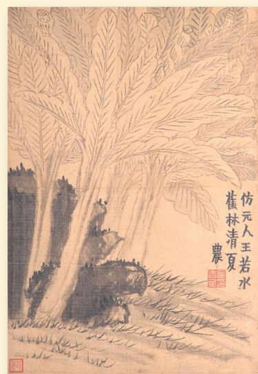
清 金农《水墨花卉册页》（十二开选六之一） 君甸艺术院藏