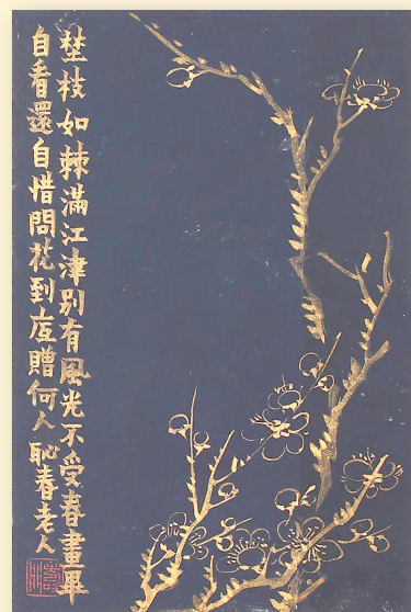
清 金农《金画梅花图册》（十二开选六之一） 福建博物院藏