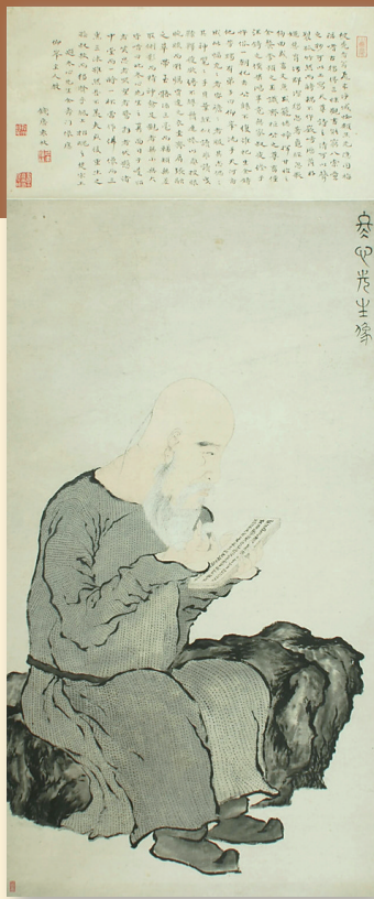
清 罗聘《金农像》 浙江省博物馆藏