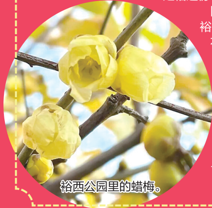
裕西公园里的蜡梅。