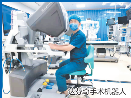
达芬奇手术机器人