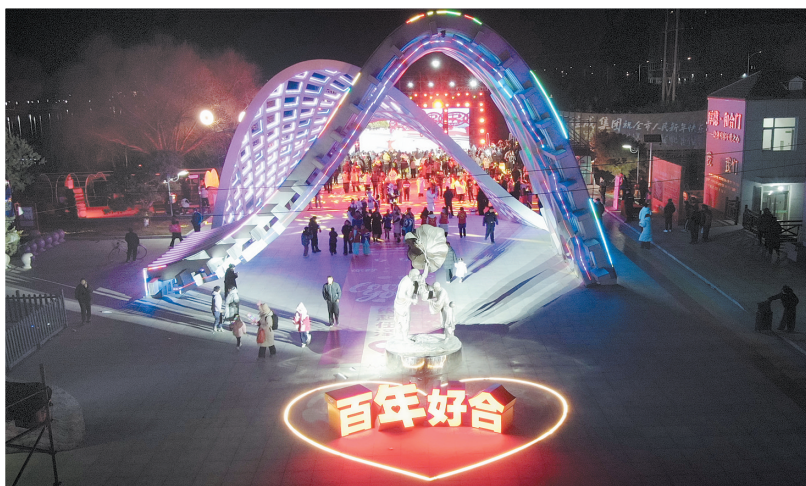
2025年12月31日晚，河北省邢台市任泽区邢泽湖、厚德·和合门“泉心意·爱在邢台——和合共新岁”元旦活动现场。

厚力五金、邢湾机械制造等3个已建成的“共享式园中园”提效，在建的3个“共享式园中园”提速，谋划的4个“共享式园中园”提质。