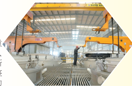
▲位于河北省邢台市任泽区邢家湾镇的龙泉剑厚力五金“共享式园中园”。

“发展邢台没有看客”。接下来，任泽区将进一步解放思想、奋发进取，大力推进“共享式园中园”建设，通过小升级、散入园、低提档，以及开展“龙头企业开放日”等举措，以“共享智造”赋能智能设备及零部件和橡塑新材料两大特色产业集群提档升级；大力推进“文商旅体健”融合发展，重点打造邢泽湖、饮马河和牛尾河骑行绿道等甜蜜经济地标，持续擦亮泉城特色旅游休闲城市品牌，迈向更高质量、更具竞争力的未来。（武娜 刘晓天 徐乐陶）