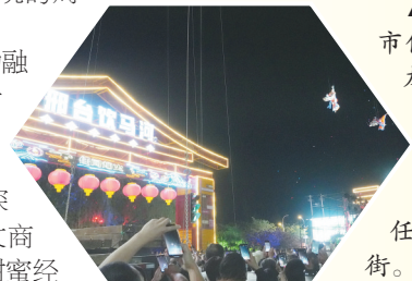
▲位于邢台市任泽区的饮马河步行街。