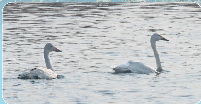
1月5日,位于滹沱河上游的灵寿县一处湿地,小天鹅(右)正在悠然游弋。

阳光洒下,小天鹅和伴侣在浅滩处惬意觅食。高玉喜举起相机,记录下这温馨一幕:“今年冬天它们在此安家,明年春天北归繁衍,我会一直关注它们,就像关注远行的孩子。希望将来能看到它们带着宝宝,再回到滹沱河这个幸福家园。”