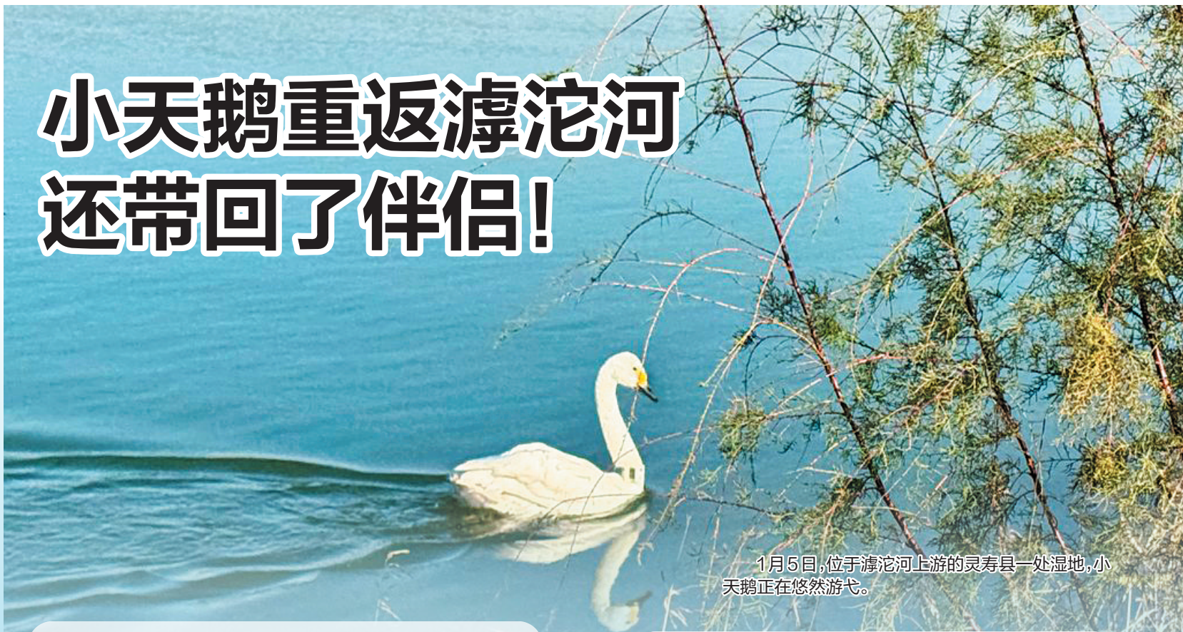
1月5日,位于滹沱河上游的灵寿县一处湿地,小天鹅正在悠然游弋。

本报讯(河北日报见习记者侯森)1月5日清晨,位于滹沱河上游的石家庄灵寿县一处湿地,一对洁白的小天鹅悠然游弋,身影倒映在如镜的水面上。