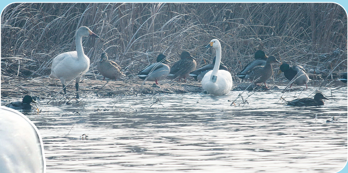
小天鹅(右)正在浅滩漫步。