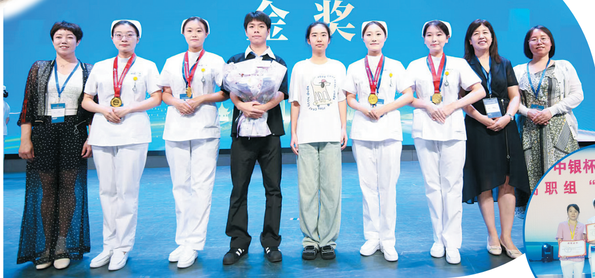
▲2025年世界职业院校技能大赛康复治疗与护理赛道（高职组）金奖照片。 ▶2022年全国职业院校技能大赛（高职）护理技能赛项一等奖照片。

2025年世界职业院校技能大赛总决赛争夺赛 2025 WORLD VOCATIONAL COLLEGE SKILLS COMPETITION 康复治疗与护理赛道（高职组）